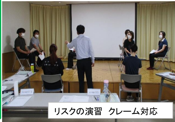
リスクの演習 クレーム対応