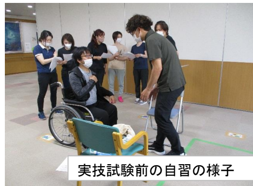
実技試験前の自習の様子