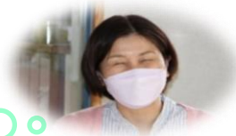
by 研修担当 香川

なんと素敵な心の持ち主だろうと、感動しました。“優しさの勉強”か…。本当の優しさってなんだろう。